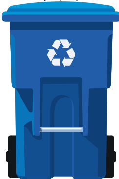
Կապույտ (վերամշակելի նյութեր)